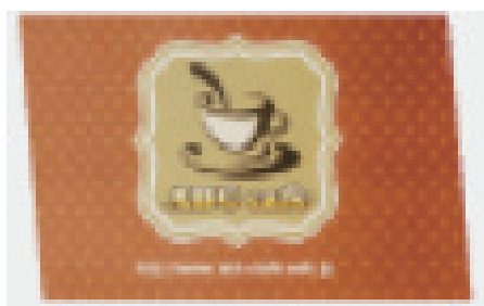
*画像 17 ひし形にカットされた状態