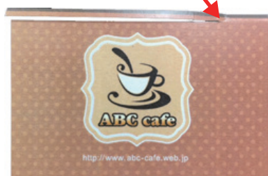
*画像 11 途中までしか切れていない